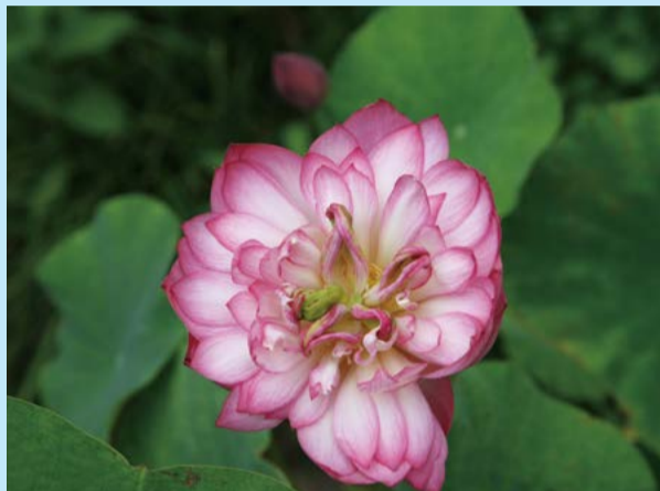
怒放 - 白皓