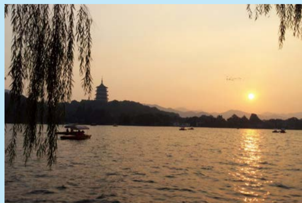
岁月静好 - 周媛媛