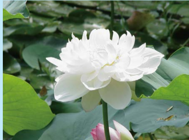
白衣仙子 - 孟娟