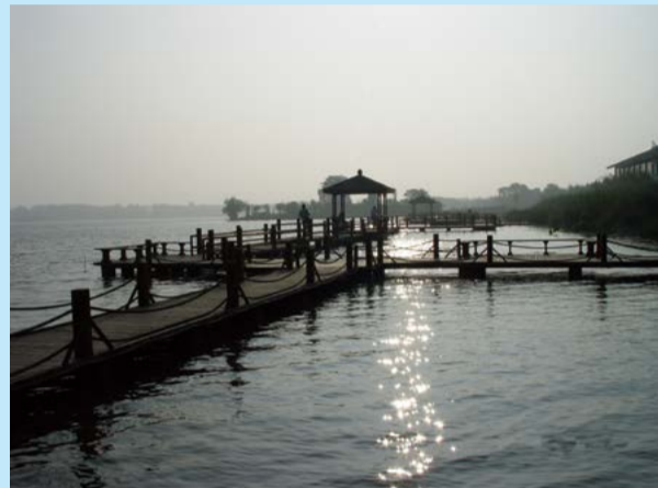
光阴 - 渠青